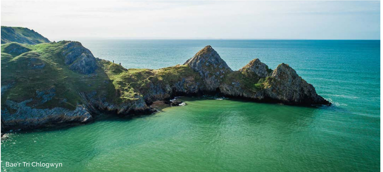
Bae'r Tri Chlogwyn