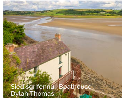
Sied sgrifennu, 'Boathouse', Dylan Thomas