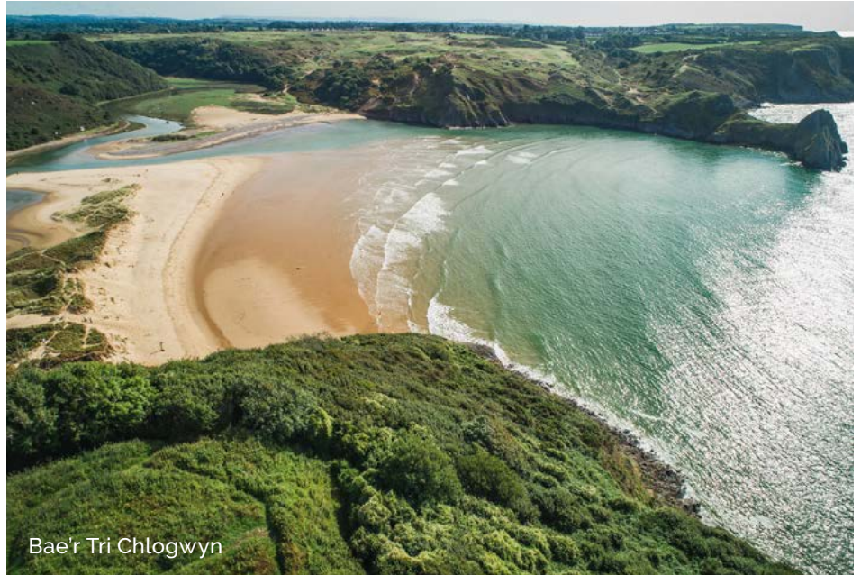
Bae'r Tri Chlogwyn